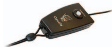
Réponse patient intégrée